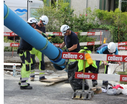
Die Mitarbeiter der GWS beim Einziehen der neuen Gusseisen-Trinkwasserrohre.

Dank eines elektronisch gesteuerten Lenksystems konnte die Bohrung millimetergenau gesteuert werden. So liessen sich Hindernisse präzise umfahren oder durchqueren. Auf der rund 330 Meter langen und stellenweise bis zu